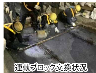
連軌ブロック交換状況

東北本線甲子街道踏切(上下)において、老朽化した接続軌道ブロックの交換工事を行いました。旧ブロックから新ブロックへと交換する工事は郡山地区では初めてでした。現場は作業間合が短く、作業方法が限定されたこともあり、施工計画に苦慮しましたが、郡山出張所担当者、保技セ担当者と密に打ち合わせを行い、最良の方法を探りながら、施工に至りました。連軌ブロックの撤去・挿入には、郡山出張所内で初めて軌陸クローラークレーン(ヘビーウエイト)を使用しました。従来大型ユニック車使用よりも、効率的かつ安全に作業を行うことができました。