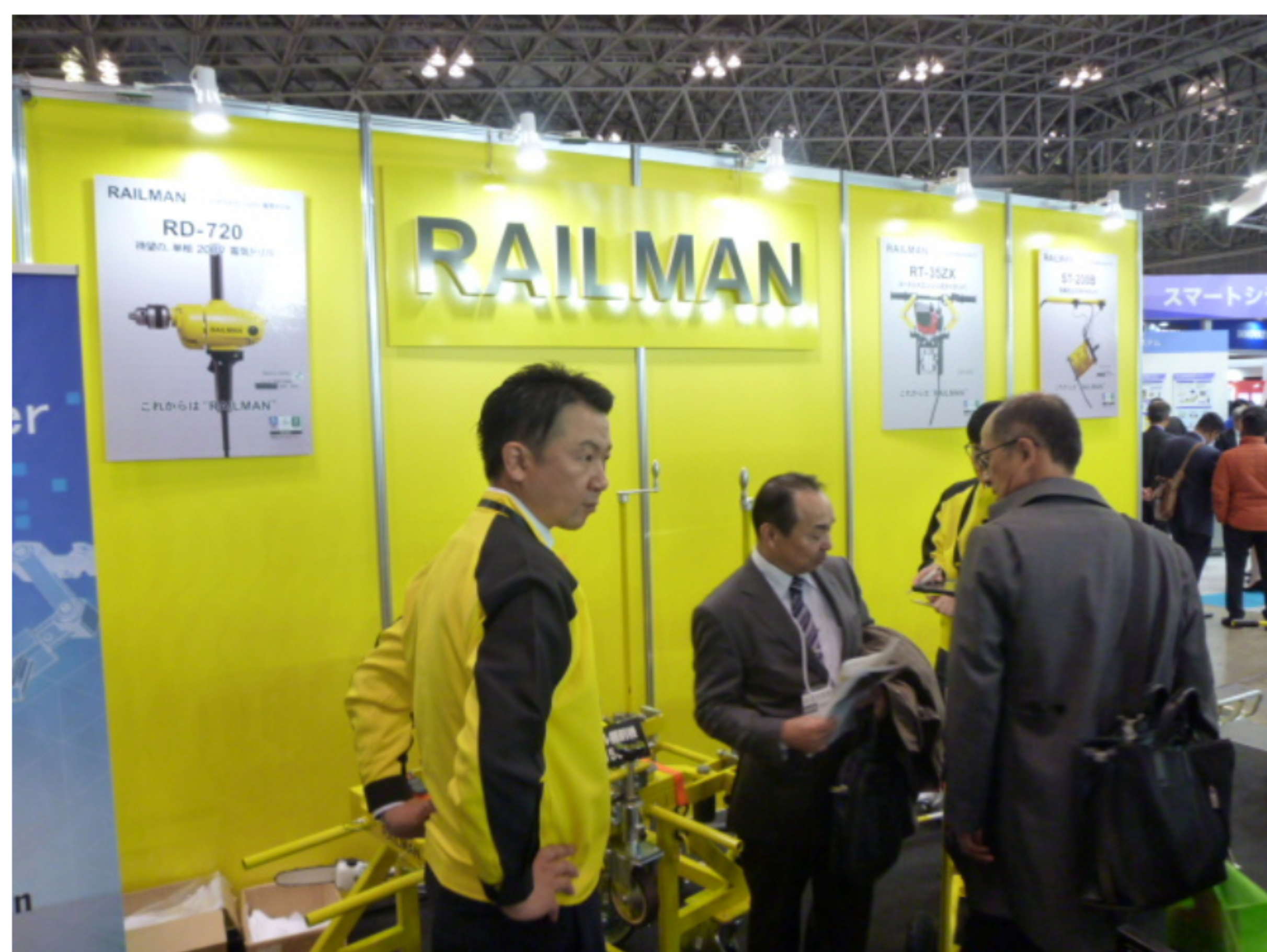
福島軌道丹治社長（右）