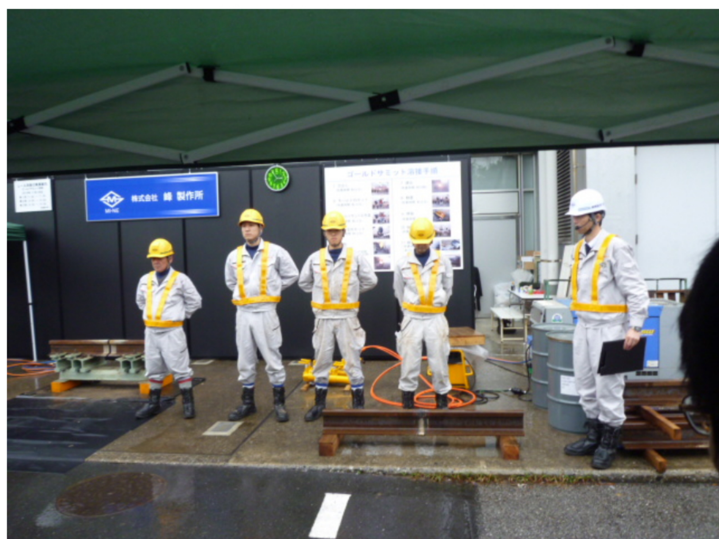
峰製作所実演様子