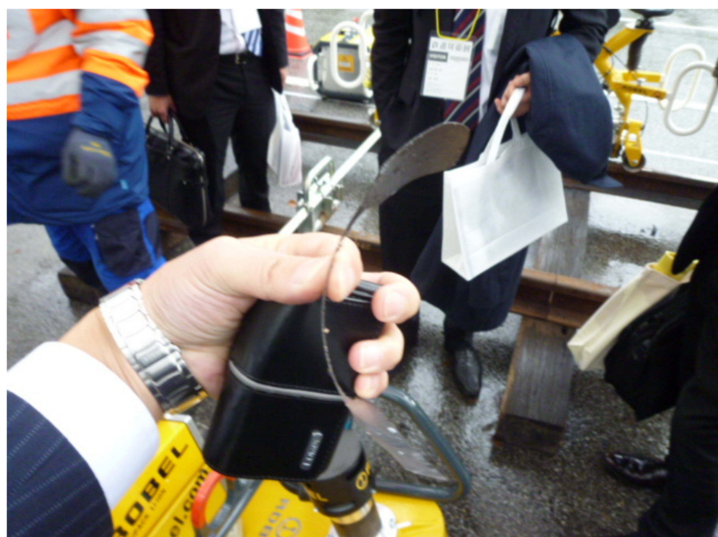
ローベル社製切断後のレール