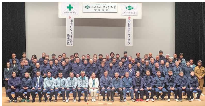
写真-3(全体集合写真)

御来賓の皆様には遠方からのご出席を戴き挨拶を承りました。今年も外部講師の方を招き、「現場におけるハラスメント防止対策について」お話をいただきました。(写真-3)